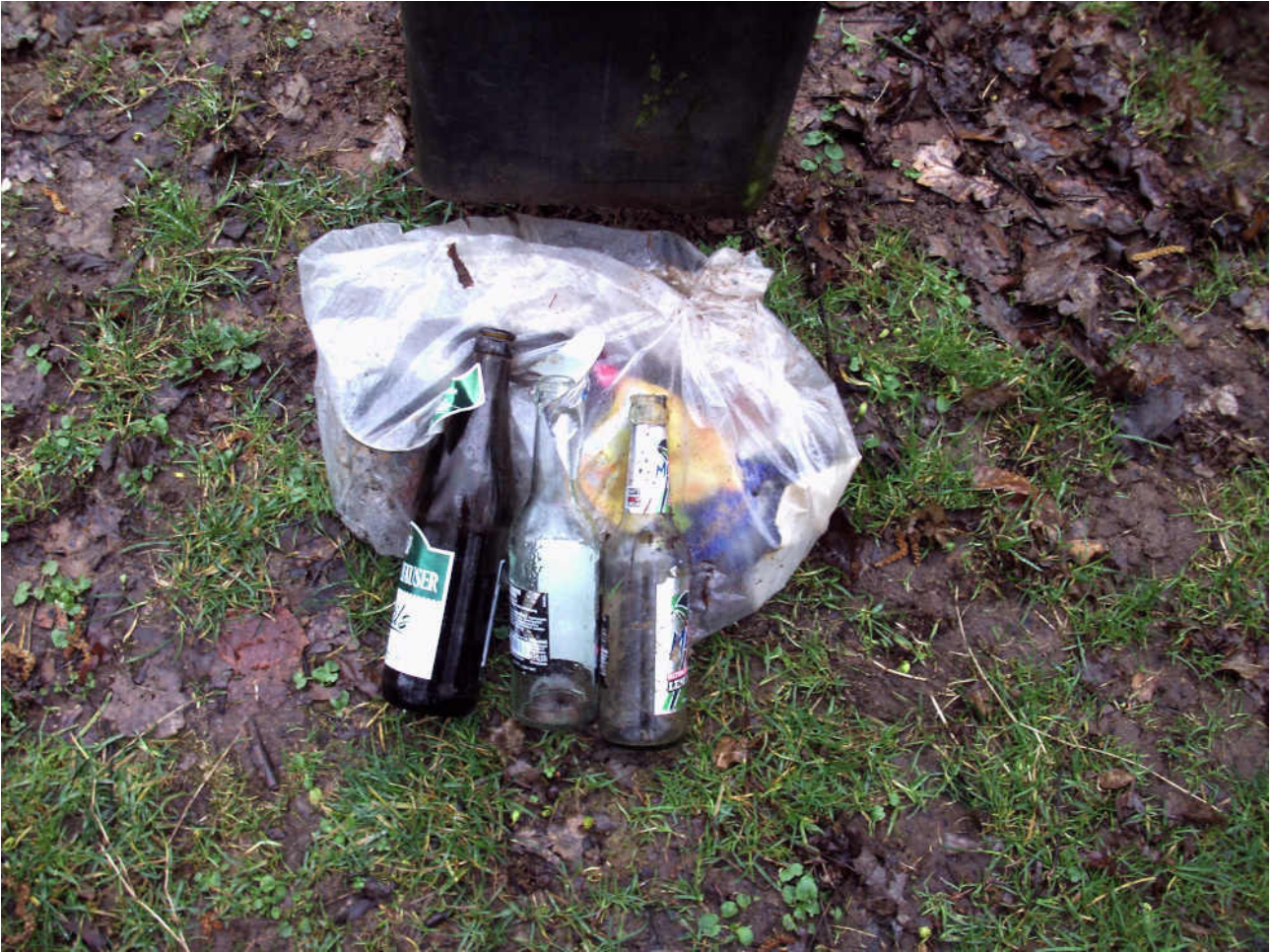
Nachlese Untere Leberklinge 10.3.2019