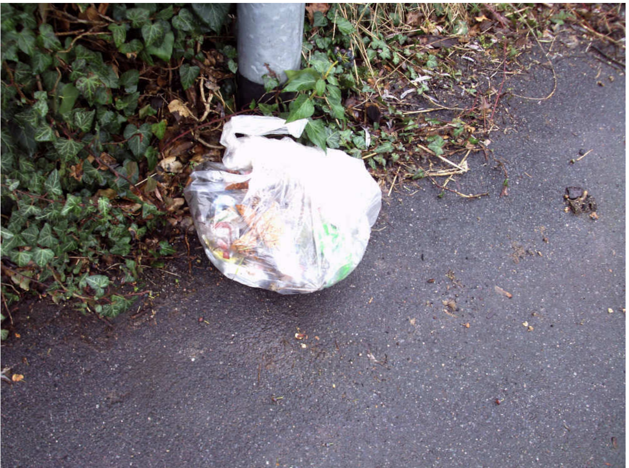
Nachlese Obere Leberklinge 10.3.2019