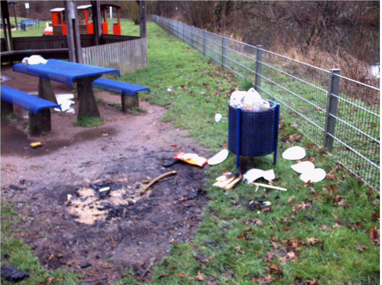
Spielplatz vorher 10.3.2019