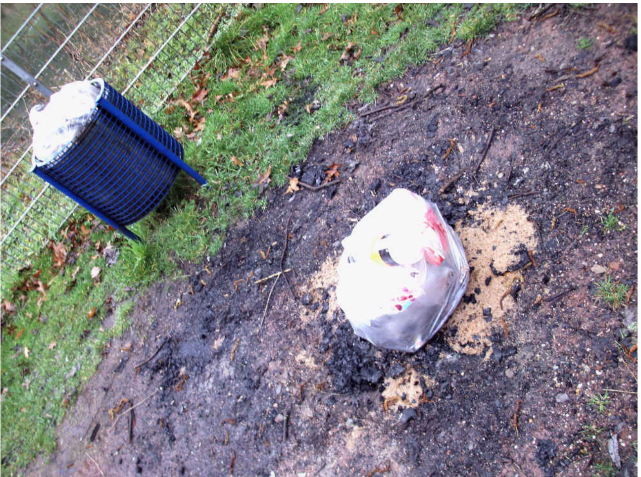
Spielplatz nachher 10.3.2019